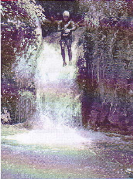
Actividad de barranquismo de una empresa de turismo activo.

Las actividades físico-deportivas en la naturaleza, organizadas por entidades con o sin ánimo de lucro (empresas de turismo activo, clubes de montaña, colegios, AMPAs, centros educativos de cualquier nivel y otro tipo de asociaciones), ha crecido exponencialmente cada año, tanto en España como fuera de nuestras fronteras. Así, según la última Encuesta de Hábitos Deportivos (2010) que elaboran el Consejo Superior de Deportes y el CIS, el 43% de los españoles entre 15 y 75 años practican algún deporte; y de éstos, un 15% realiza actividades de aventura en la naturaleza, unos 2.300.000 personas . Los tipos de actividades de aventura que más se realizan son: el 77% terrestres, 15% acuáticas y 6%